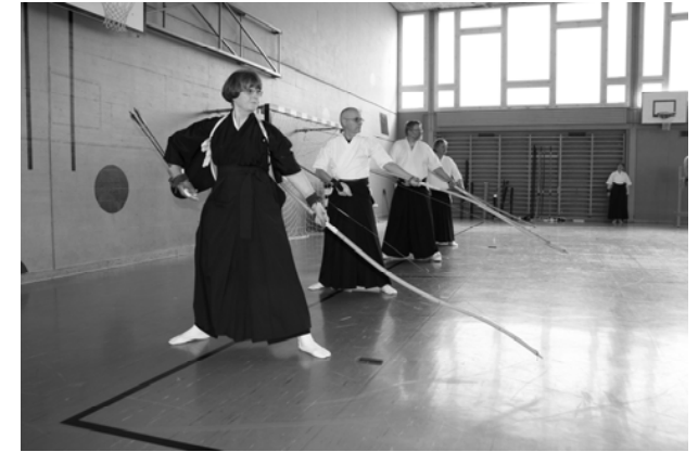
Hitote-Praxis (28 m) in der Turnhalle der Sek. Bümpliz

Wir praktizieren den Stil: Heki Ryu Bishu Chikurin Ha.