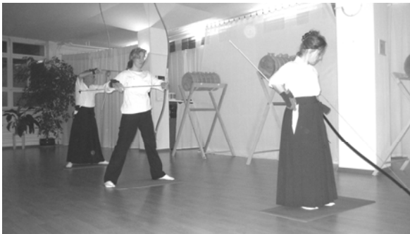
Makiwara-Praxis (2 m Distanz) im Raum Stille Bewegung

Kyudo schult Konzentrationskraft und Gelassenheit, es schärft die innere Wahrnehmung und wirkt sich positiv auf Körperhaltung, Balance und Bewegungskoordination aus. Kyudo ist aber auch geistiges Üben zur Entwicklung der Persönlichkeit. Da es nicht auf Muskelkraft ankommt, sondern auf sensible Bewegungskoordination, ist Kyudo für Frauen und Männer jeden Alters geeignet.